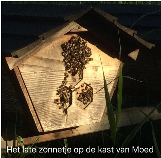
Het late zonnetje op de kast van Moed

Het zeiscollectief heeft met succes zeisles gegeven aan een aantal enthousiastelingen, wat heeft geleid tot een mooi resultaat. Voor ons is het zeiscollectief onmisbaar, vanwege hun ervaring en hun zeisen.