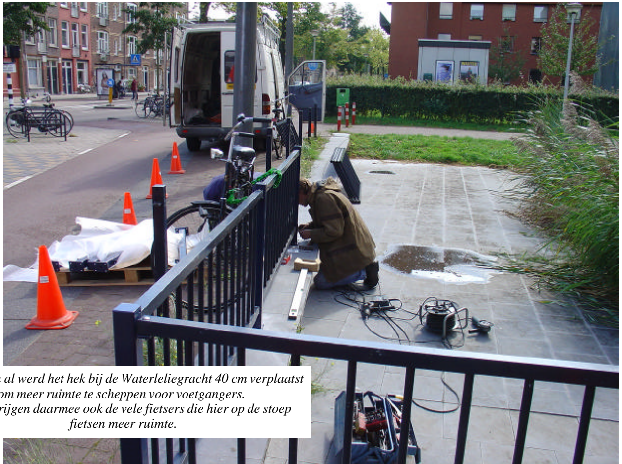
Met fiets en al werd het hek bij de Waterleliegracht 40 cm verplaatst om meer ruimte te scheppen voor voetgangers. Helaas krijgen daarmee ook de vele fietsers die hier op de stoep fietsen meer ruimte.