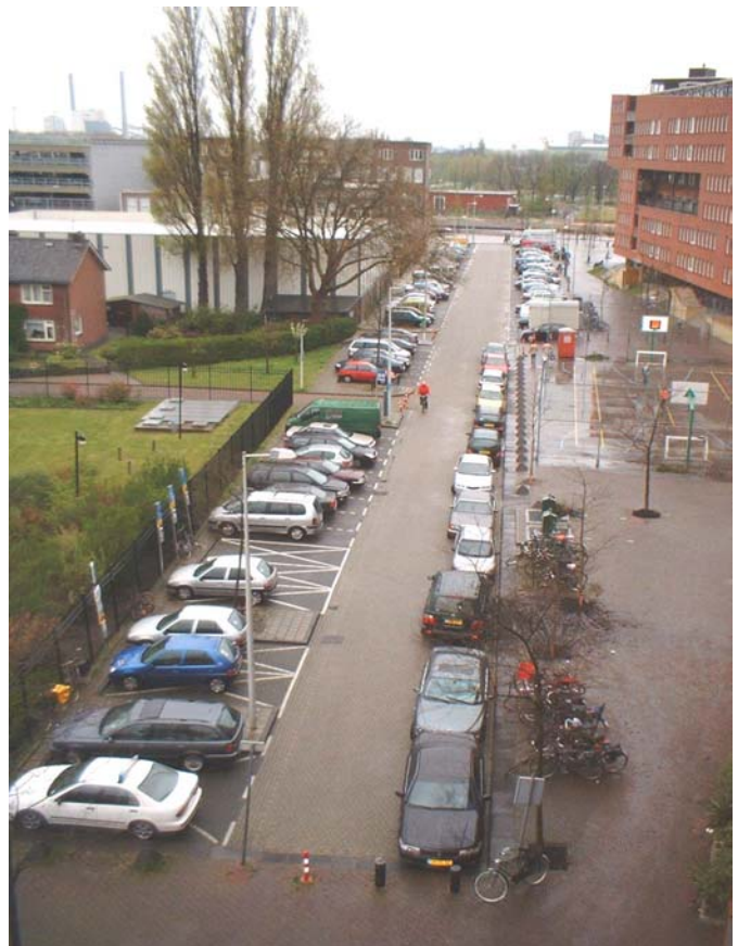
Een normale zondagmiddag aan de Waterpoortweg. Parkeren buiten de vakken niet toegestaan?

Dat parkeren niet voor iedereen problemen geeft toont deze foto van (elf) fout geparkeerde auto's.