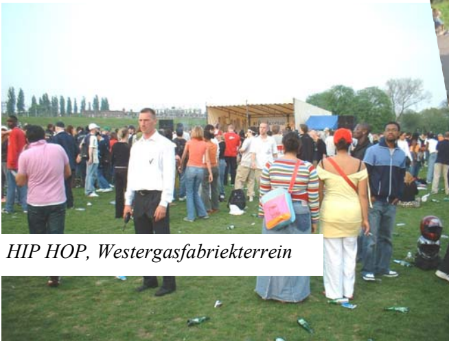
HIP HOP, Westergasfabriekterrein