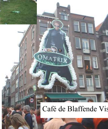
Café de Blaffende Vis, Westerstraat

Meer foto's op de website www.gwl-terrein.nl