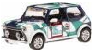
Opgave Mini's bij redactie@gwl-terrein.nl