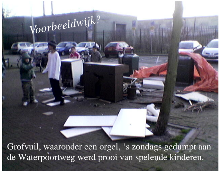
Grofvuil, waaronder een orgel, 's zondags gedumpt aan de Waterpoortweg werd prooi van spelende kinderen.