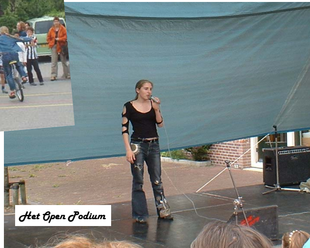
Het Open Podium