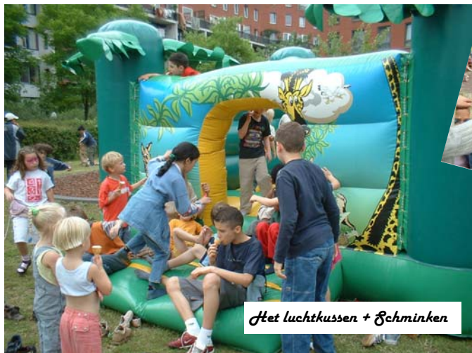
Het luchtkussen + Schminken

Zaterdag 26 juni was het weer feest op het terrein, voor de jeugd vanaf half drie met een luchtkussen, schminken en een fotospeurtocht. Daarna begon het open podium, bedoeld voor alle bewoners, en ook hier was het de jeugd die z'n talenten toonde.