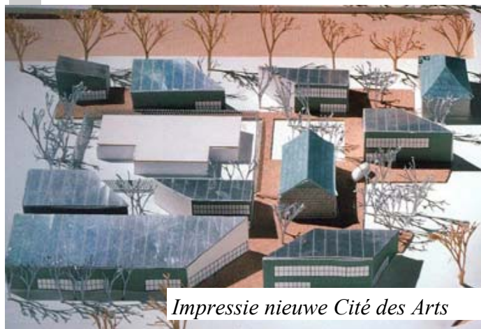
Impressie nieuwe Cité des Arts