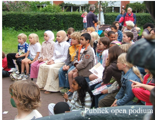
Publiek open podium