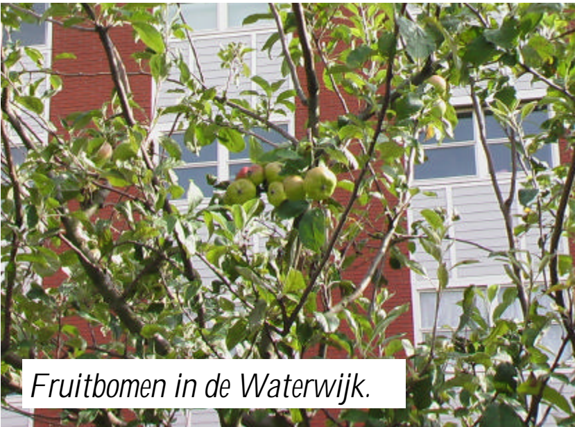
Fruitbomen in de Waterwijk.

In deze Waterspiegel een prominente plaats voor de fruitbomen in de wijk. We willen namelijk de appels gaan plukken en misschien willen bewoners daarbij helpen. Het moet op redelijk korte termijn, omdat kinderen ook proberen appels te plukken en al verscheidene bomen beschadigd zijn. Dat laatste kan natuurlijk nooit de bedoeling zijn. Meer informatie over de fruitbomen op pagina vijf.