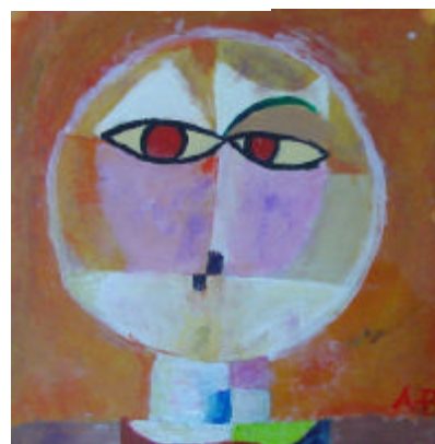
Schilderijtje van Asthma Benzian

Kijk op de Wijk wordt 's avonds afgesloten met een openluchtfilmvoorstelling bij Het Ketelhuis.